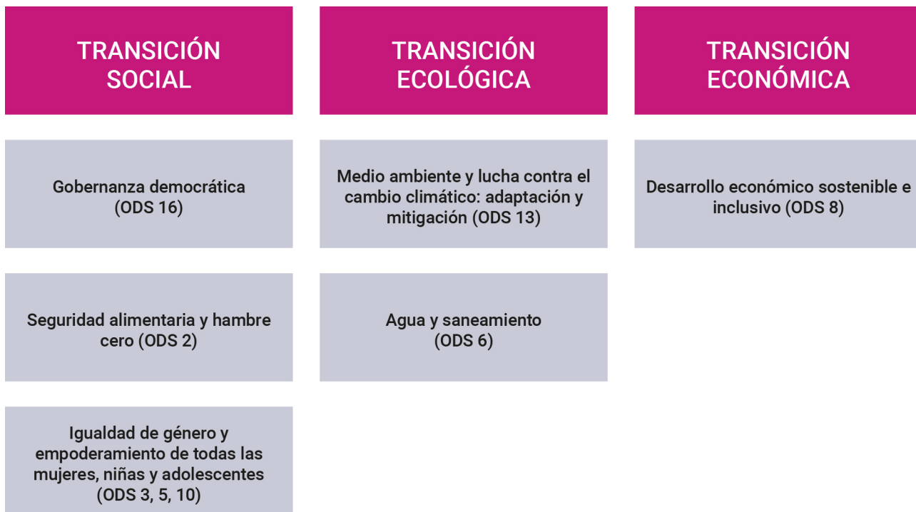
Fig. 2. Objetivos y retos compartidos fijados por la ADS

apoyará sectores industriales clave, con énfasis en la transferencia tecnológica y la sostenibilidad. Se buscará reforzar capacidades productivas y facilitar el acceso de productos egipcios a mercados europeos. La CE promoverá también la transición hacia una economía circular.