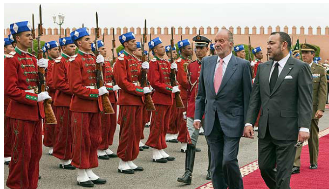
S.M. el Rey Juan Carlos I durante su visita a Marraquech junto al Rey de Marruecos, Mohamed VI, en mayo de 2011.

Ha formado parte de dos movimientos políticos, el MUR (Movimiento Unidad