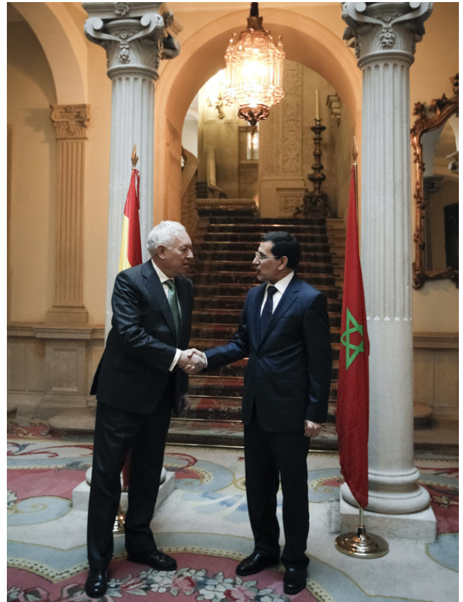
El ministro de Asuntos Exteriores y de Cooperación saluda a su homólogo marroquí, Saâd-Eddin El Ozmani, durante su visita al Palacio de Viana, sede del Ministerio de Asuntos Exteriores y de Cooperación, en febrero de 2013.

ENDESA – participa en el ciclo combinado de 384 MW en Tahaddart, emplazamiento situado a unos 30 km de la ciudad de Tánger ISOFOTON – Implantación: sede en Casablanca, gestión integral de proyecto de electrificación rural. INABENSA-ABENER (ABENGOA) – Implantación: gestiona una central termo-solar de ciclo combinado de Ain Beni Mathar de (450MW + 20MW solares) METRAGAZ - compañía encargada de operar el tramo marroquí del gasoducto Magreb-Europa. Esta infraestructura de transporte une los yacimientos argelinos de Hassi RMeI con la red española de gasoductos REPSOL - después de exploraciones fallidas de petróleo, está centrada actualmente en exploraciones de gas