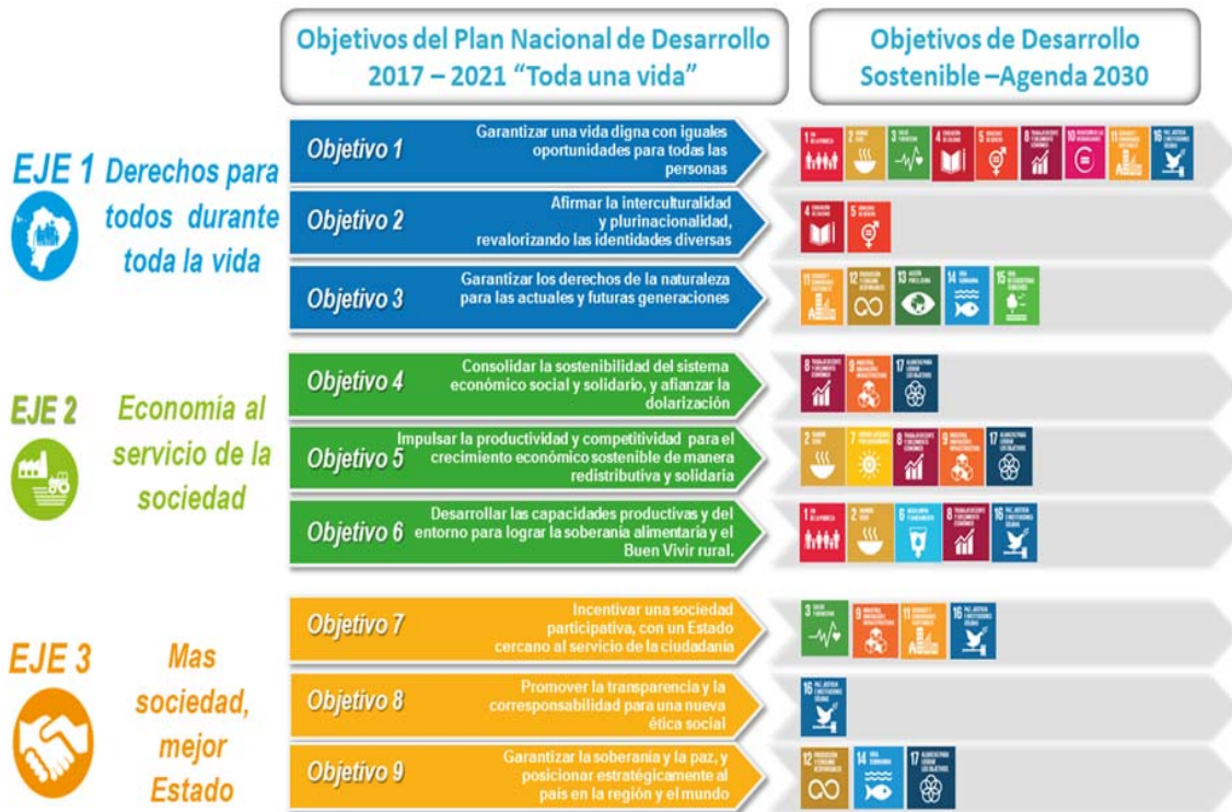
Gráfico I. Alineamiento de los Objetivos del PND 2017-2021 con los ODS

Para asegurar el cumplimiento de dichos compromisos, desde la Secretaría Nacional de Planificación y Desarrollo - SENPLADES se ha analizado los vínculos del Plan Nacional de Desarrollo 2017-2021 con la Agenda 2030 para el Desarrollo Sostenible, evidenciando los puntos de articulación e identificando las necesidades de evaluación, monitoreo y seguimiento a los ODS, desde la planificación nacional (Gráfico I).