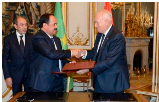
El entonces ministro de Asuntos Exteriores y de Cooperación, José Manuel García-Margallo, saluda a su anterior homólogo mauritano, Hamadi Ould Meimou, durante su visita a Madrid en noviembre de 2015.

Existe un Acuerdo de Cooperación bilateral entre ambos Ministerios del Interior, que ha permitido poner en marcha en Nuadibú sendos equipos conjuntos de nuestra Policía Nacional y la Guardia Civil con la Policía y la Gendarmería mauritanas, respectivamente (la Guardia Civil opera con dos patrulleras, un helicóptero BO-105 y, ocasionalmente, un avión de patrulla marítima CN-235, para las labores de apoyo en la vigilancia marítima). Además, en mayo de 2014 comenzaron a ponerse en marcha patrullas terrestres conjuntas entre la Guardia Civil y la Gendarmería para la vigilancia costera. La cooperación hispano-mauritana en la