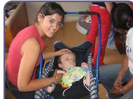
Animación a niños deficientes y de la Casa Cuna