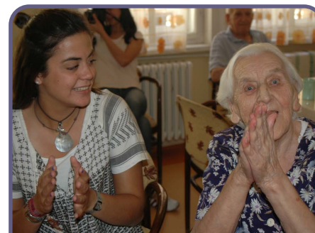
Atención y asistencia domiciliaria