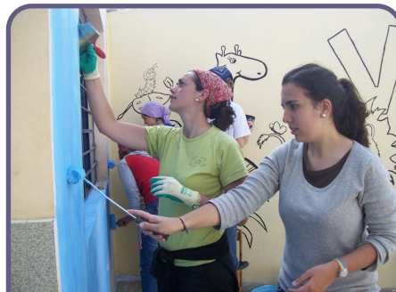
Campos de trabajo en verano