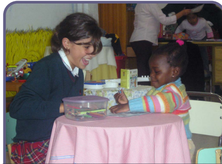
Apoyo escolar a inmigrantes e integración social